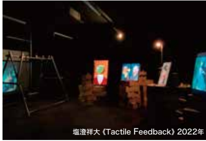
塩澄祥大 (Tactile Feedback) 2022年