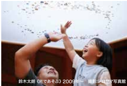
鈴木太郎 (光であそぶ) 2009年〜