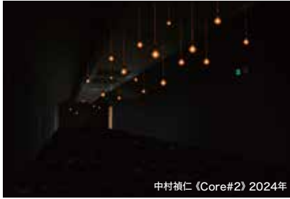
中村禎仁 (Core#2) 2024年

かつて炭坑産業で栄えた田川市には、「やみ」が支配する坑道という地下と、「ひかり」に満ちた地上という対照的な2つの世界が存在していました。本展は、こうした筑豊・田川の地域性を美術館の展示室に再現しようとするものです。「やみ」と「ひかり」をそれぞれの視点でとらえる4名の現代作家の作品が展示室いっぱいに広がります。体感型のインスタレーションや体験型のメディアアートをとおして、からだ全体でアートを楽しめる機会となります。見て、触って、聴いて...様々な感覚を刺激するアートをお楽しみください。