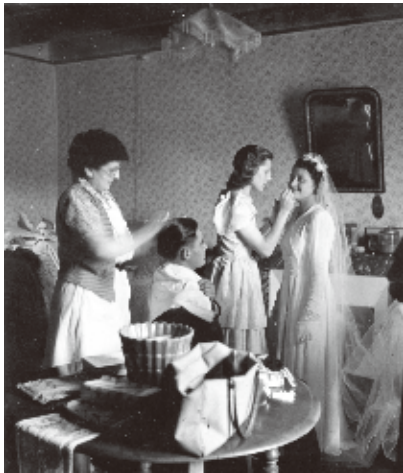
ロベール・ドアノー「4本のヘアピン、サン・ソヴァン」 1951年