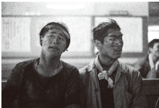
本橋成一「羽幌炭坑 北海道 羽幌町」炭鉱より 1968年

毎年恒例となっている田川の子どもたちによる絵画展。田川市郡に在住・通学する小・中・高校生から作品を募集し、集まった約4000点の中から、入賞・入選作品約700点を選んで展示します。