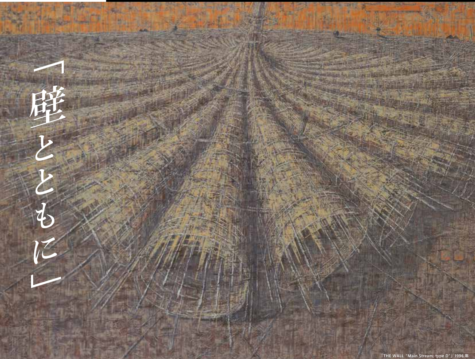
「THE WALL "Main Stream; type D"」1996年